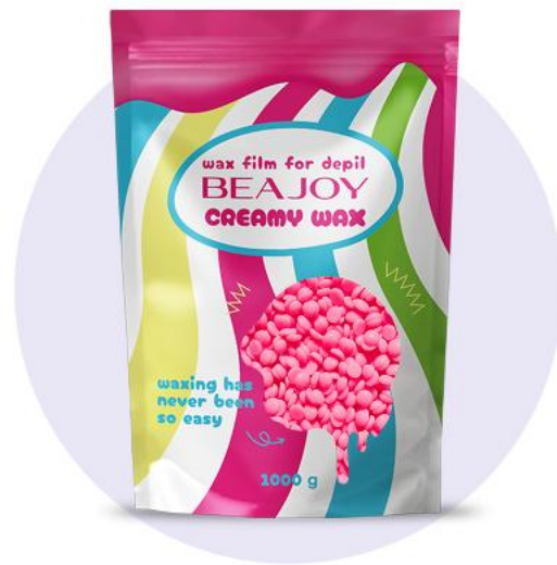
БАБЛ-ГАМ (BUBBLE GUM)

Уровень мастера - юниор, эксперт, профи Тип волос - для всех типов волос Работает - по тальку Время застывания, сек. - 7-9 Рабочая температура, С° - 36-38