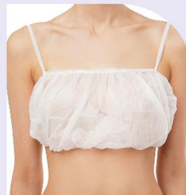
Топ с открытой спиной