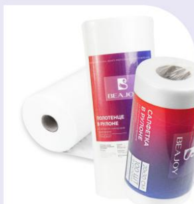
Салфетки в пачке и в рулоне