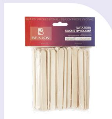
Шпатели в ассортименте