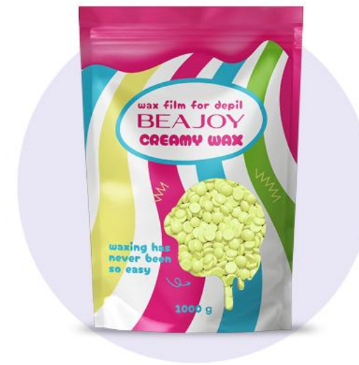
ЛИМОННЫЙ СОРБЕТ (LEMON SORBET)

Уровень мастера - юниор, эксперт, профи Тип волос - для всех типов волос Работает - по тальку Время застывания, сек. - 7-9 Рабочая температура, С° - 36-38