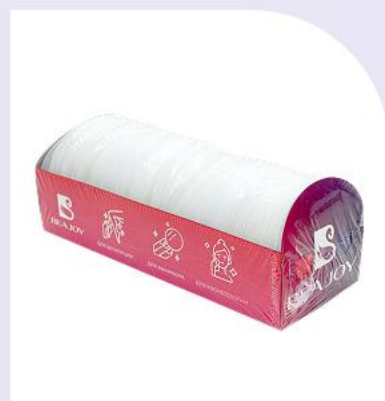
Диски спанлейс с кармашком