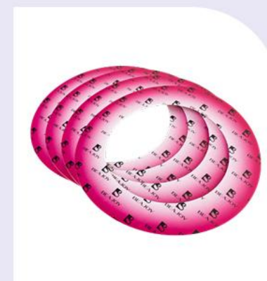
Кольца защитные для воскоплава

С полным ассортиментом можно ознакомиться в прайс-листе